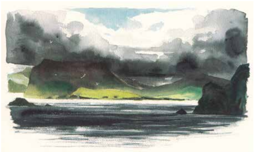
Voyage aux îles de la désolation, p 107, Emmanuel Lepage

Ci-dessus vous pouvez voir un dessin que Lepage a fait au cours d'un voyage. Souvent les couleurs sont appliquées plus tard par un employé (coloriste) mais dans ce cas tout est fait par une seule personne. À votre avis, quelle technique utilise-t-il, et pour quelle raison ?