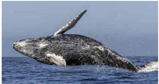
Baleine à bosse