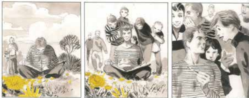
Un printemps à Tchernobyl, Emmanuel Lepage © Futuropolis

Bienvenue dans les aventures d'Emmanuel Lepage ! Grâce à ce guide, vous pourrez parcourir cette exposition temporaire du Musée de la Bande Dessinée et découvrir le magnifique travail de ce dessinateur. Bon voyage !