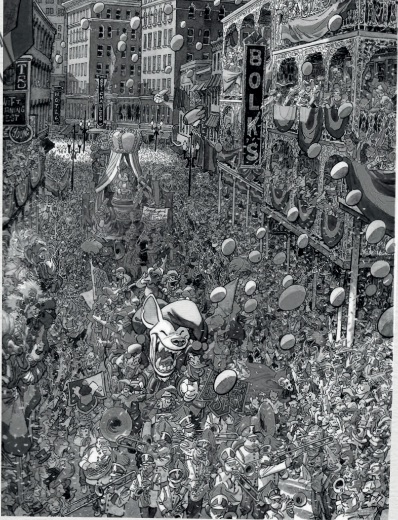
© Juanjo Guarnido / Blacksad 4: De hel, de stilte (2010), pg -32 Dargaud

Indien de dief probeert te ontsnappen, moet er ook van zijn voertuig een beschrijving zijn. Het is een rode wagen, misschien kan je het merk ook vinden?